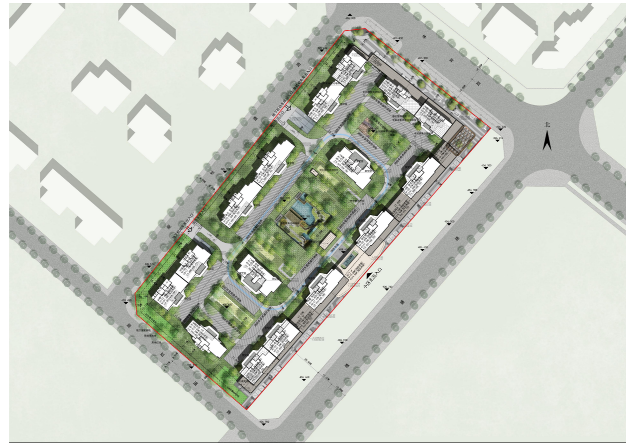
综合技术经济指标表

该项目方案已经批准，根据《中华人民共和国城乡规划法》第四十条、《四川省城乡规划条例》第四十八条之规定，现予以公布。