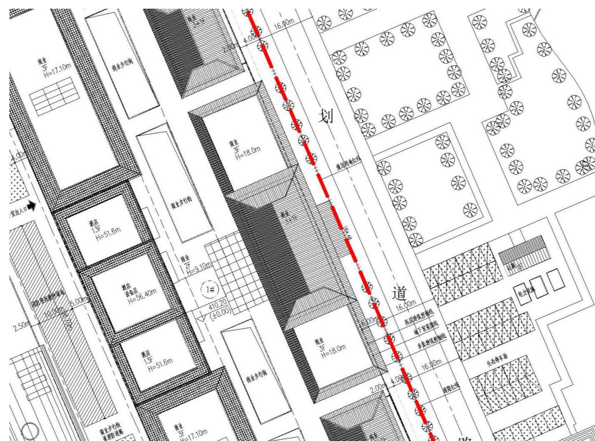
主要经济技术指标表